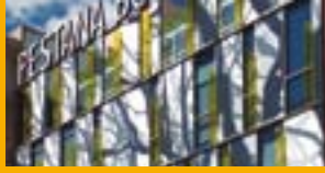
PEGADO Y SELLADO